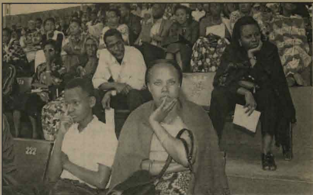
Indishyi zibonekeye igihe zafasha benshi mu bibazo batewe na jenoside

Ariko noneho ngo ugiye kubara indishyi, ni ngombwa no kureba ukwiriye izo ndishyi. Mu gihe cyo kwegeranya ibitekerezo muri izo nama zavuzwe, abantu bakareba igikwiriye gukorwa, wasangaga ntaho wahera uvuga ngo uyunguyu ntazikwiriye kubera ko yaba afitanye isano n'uwishwe ku rwego uru n'uru. Ni ukuvuga ko ari nk'umubyeyi wishwe ukavuga uti "abana be nibo bakwiriye indishyi ukagarukiriza aho, wakwibaza impamvu abuzukuru be, bo baba basigaye. Ndetse ukaba wanavugaga uti ese ababyeyi b'uwo mubyeyi cyangwa abavandimwe be, bo urabasigira iki? Nta kintu yari abamariye cyahungabanye cyangwa kitakigerwaho, ku buryo nabo bagombye kuba mu mubare w'abakwiriye indishyi?"