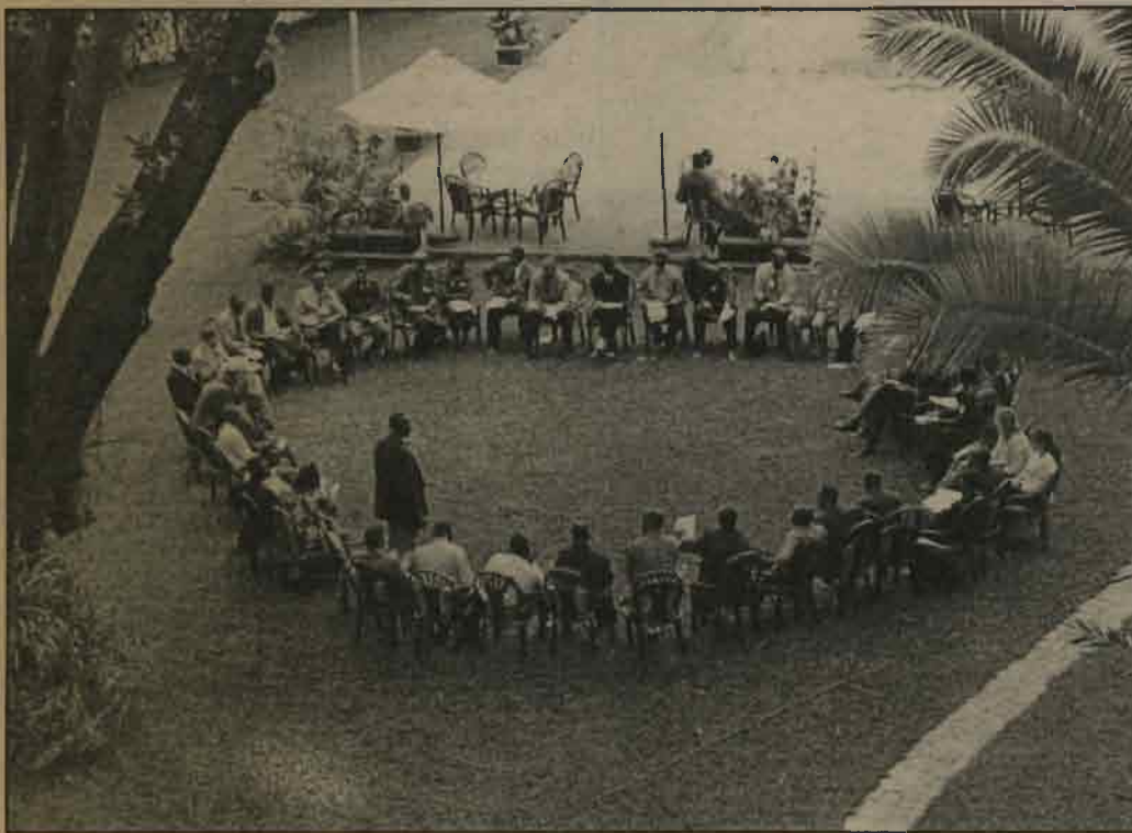
Haracyatekerezwaga byinshi kugira ngo habeho ubutabera bubereye abaturarwanda

ntizishobora gukomeza gukora kuko zahura n'ikibazo cy'ububasha bushingiye ku ifasi n'imiterere y'inzego zazo harimo n'icy'inyangamugayo nkuko zabitorewe. Ni ngombwa rero ko itegeko ngenga rigena imiterere, ububasha n'imikorere by'inkiko gacaca rivugururwa, ku butyo zikomeza kugira ububasha ku butaka zakoreragaho.