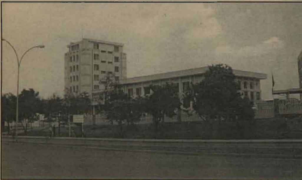
Urukiko rw'Ikirenga ntirwahinduye icyicaro