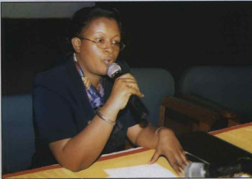
"Leta irimo kureba uburyo hajyaho ikigega cyo gufasha abacitse ku icumu kugira imibereho myiza" Mukabagwiza Edda, Minisitiri w'Ubutabera.

Ikibazo cy'indishyi z'abacitse ku icumu rya jenoside yo muri 1994 gihangayikishije Leta n'abanyarwanda b'ingeri zose, ku buryo benshi bibaza uko bizagenda, abandi bakibwira ko Leta yatereranye abacitse ku icumu; aba na bo bakabona ko bavukijwe uburenganzira bwabo bwo guhabwa indishyi zijyanye n'ababo bishwe muri jenoside. Ikinyamakuru Inkiko Gacaca cyegerereye Minisitiri w'Ubutabera, Madamu Mukabagwiza Edda, kimubaza aho gushaka umuti w'icyo kibazo bigeze.